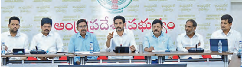
మంగళవారం మంత్రి వర్గ ఉపసంఘం భేటీలో మాట్లాడుతున్న మంత్రి లోకేష్

ఉచిత ఇళ్ల స్థలాల పంపిణీ వేగవంతం కావాలి ఆర్టీఐఎన్ నుంచి వివిధ శాఖల సమీక్షలో సిఎం చంద్రబాబు అవేర్ 2.0 మొబైల్ యాప్ ను ప్రారంభించిన ముఖ్యమంత్రి విజయవాడ, ఏప్రిల్ 7 ప్రభాతవార్త ప్రతినిధి: ప్రభుత్వం అత్యంత ప్రాధాన్యంగా తీసుకున్న పథకాలు.. కార్యక్రమాలను వచ్చా ప్రజాశీలకతో అమలు చేయాలని ముఖ్యమంత్రి నారా చంద్రబాబు నాయుడు స్పష్టం చేశారు. ప్రభుత్వ పథకాలను ప్రజలకు చేరువ చేయడంతోపాటు.. సంతృప్తి కలిగించే రీతిలో సేవలు అందించేందుకు మంచి ఫలితాలు వస్తాయన్నారు. నిర్దేశించుకున్న లక్ష్యాలను చేరుకునే విషయంలో ఎలాంటి జాప్యమూ జరగకూడదని ముఖ్యమంత్రి ఆదేశించారు. మంగళవారం ఆర్టీఐఎన్ నుంచి వివిధ శాఖల పని తీరుపై సమీక్షించారు. ఈ సందర్భంగా ముఖ్య మంత్రి మాట్లాడుతూ ఈ ఏడాదిలో మరోసారి సామాజిక గృహ ప్రాజెక్టుల కార్యక్రమం చేపట్టాలని నిర్ణయించుకున్నామని, ఆ దిశగా గృహ నిర్మాణశాఖ వేగంగా పనిచేయాలన్నారు. టీడీపీ ఇళ్ల కాకుండానే మరో 5 లక్షలకు ఇళ్ల నిర్మాణాన్ని పుర్రెపేసి అభిదారులకు అందించాలని, ఇళ్ల నిర్మాణాన్ని పూర్తి చేసే విషయంలో ఎక్కడా ఆలస్యం కాకుండా వచ్చా ప్రజాశీలకతో అమలు చేయాలని విధంగా ఇళ్ల నిర్మాణం చేపడుతున్నామని అభిదారులతో సంతోషం వ్యక్తం చేయాలని సేవలను అందించాలని, ఇళ్ల నిర్మాణంతోపాటు ఇంటి స్థలాల పంపిణీ ప్రక్రియను వీలైనంత త్వరగా ప్రారంభించాలి సుమారు 2లక్షల మంది ఇళ్ల స్థలాలు కోరినట్లు సర్వేలో తేలింది. ఆ దిశగా అధికారులు చర్యలు తీసుకోవాలి. ఇళ్ల నిర్మాణాన్ని ఎంత వేగంగా చేపడుతున్నారో ఇళ్ల స్థలాలు పంపిణీని కూడా అదే స్థాయిలో చేపట్టాలి ప్రజాశీలకల సీద్ధం చేయాలి. ఇక పర్యాటకం ఇంకా సరఫరాలో ఇబ్బందులు రాకుండా ఇప్పటి నుంచే జాగ్రత్తలు తీసుకోవాలి. ప్రజలకు ఇసుకను ఉచితంగా ఇస్తున్నాం. ప్రభుత్వానికి వచ్చే ఆదాయాన్ని పడు లుకుంటున్నాం. >>2